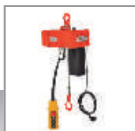
POLIPASTO DE CADENA MODELO COMPACT Pág. 96