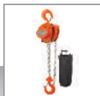
POLEAS MANUALES SERIE 630 Pág. 8