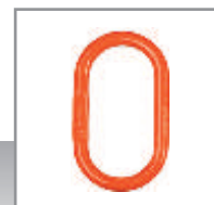
ANILLA OVALADA Pág. 54